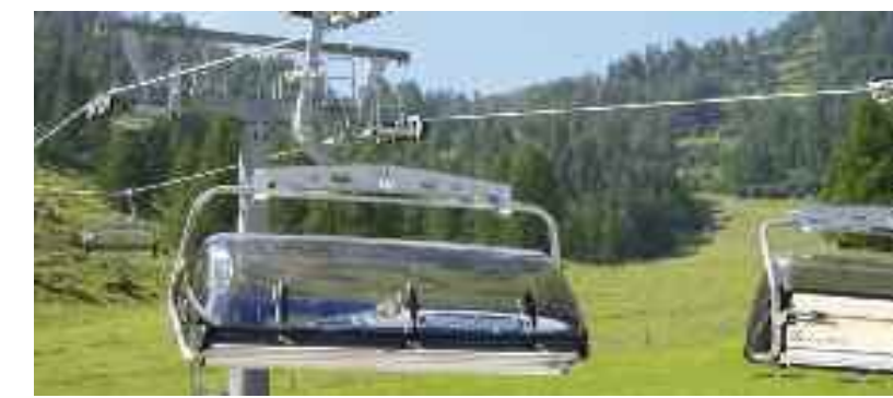
Die Gamskogelbahn, der ideale Ausgangspunkt für Ihre Wanderungen

TARIFE Information über Preise für Einzelfahrt, Berg- und Talfahrt erhalten Sie unter: Zauchensee Liftgesellschaft Tel.: 0452/4000.