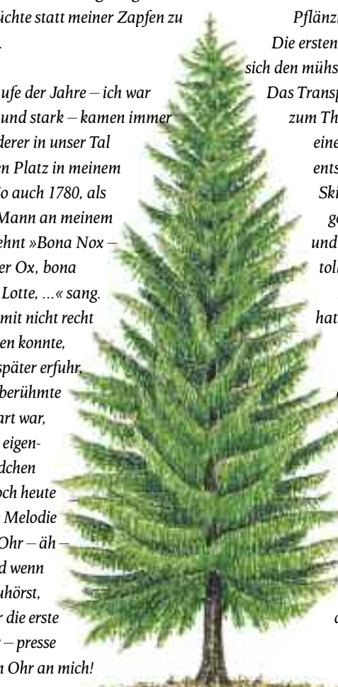
Die Fichte mitten in Zauchensee, ein Dokument aus vergangener Zeit erzählt.

Im Laufe der Jahre – ich war schon groß und stark – kamen immer mehr Wanderer in unser Tal und nahmen Platz in meinem Schatten. So auch 1780, als ein junger Mann an meinem Stamm geleht »Bona Nox bist a rechter Ox, bona notte, liebe Lotte, ...« sang. Und ich damit nicht recht was anfangen konnte, bis ich viel später erfuhr, dass es der berühmte W. A. Mozart war, der mir das eigenartige Ständchen brachte. Noch heute hab' ich die Melodie in meinem Ohr – äh Stamm, und wenn du genau zuhörst, singe ich dir die erste Strophe vor – presse einfach dein Ohr an mich!