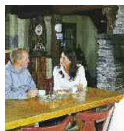
Gemütlichkeit am offenen Kamin

Die Hütte ist täglich bei Schönwetter bis Mitte September geöffnet und kann von Zauchensee aus zu Fuß in einer Gehzeit von 1,5 Stunden oder mit der Bahn in nur 10 Minuten erreicht werden.