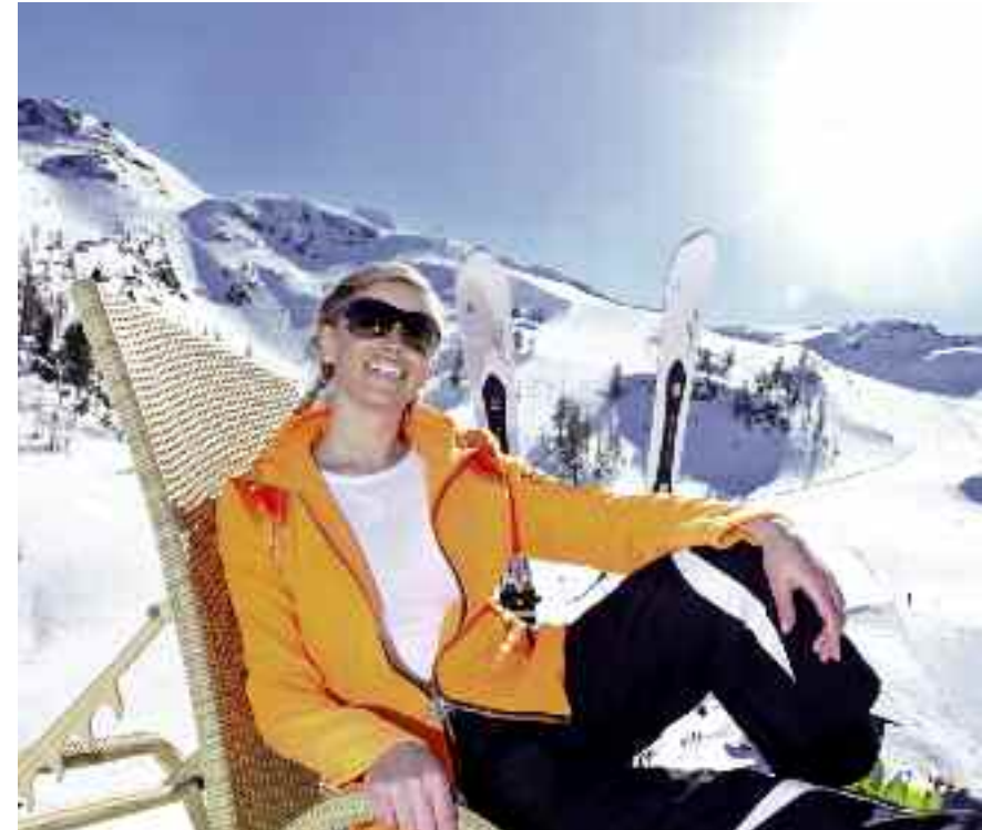
Gamskogel im Winter

Das schneesichere Skiparadies Zauchensee liegt mitten in der Region Ski amadé, die mit 270 Liften und 860 Pistenkilometern das Mekka aller Wintersportbegeisterten ist! Im Winter ist Zauchensee die Weltcupregion mit sonnigen Familienpisten, Tiefschneeabfahrten, herausfordernden Buckelpisten, langen Abfahrtsstrecken und rasanten Weltcup-Rennen.