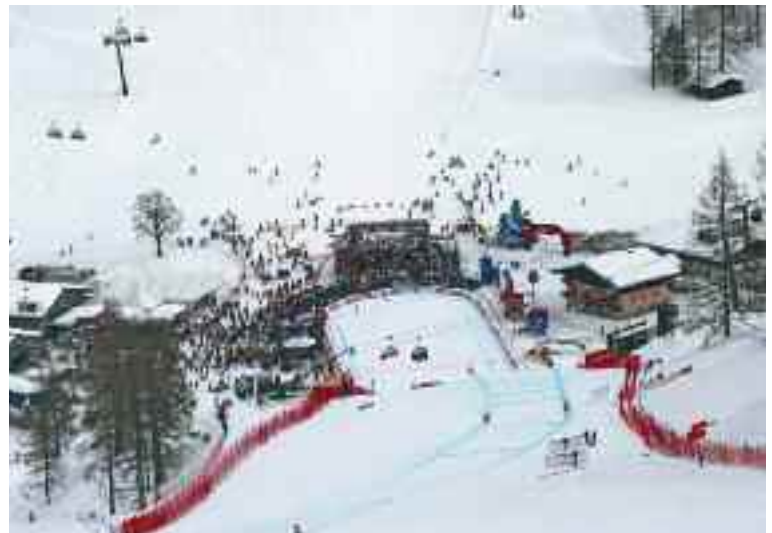
Zielgelände bei Weltcuprennen

Das schneesichere Skiparadies Zauchensee liegt mitten in der Region Ski amadé, die mit 270 Liften und 860 Pistenkilometern das Mekka aller Wintersportbegeisterten ist! Im Winter ist Zauchensee die Weltcupregion mit sonnigen Familienpisten, Tiefschneeabfahrten, herausfordernden Buckelpisten, langen Abfahrtsstrecken und rasanten Weltcup-Rennen.