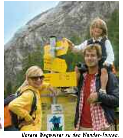
Unsere Wegweiser zu den Wander-Touren.